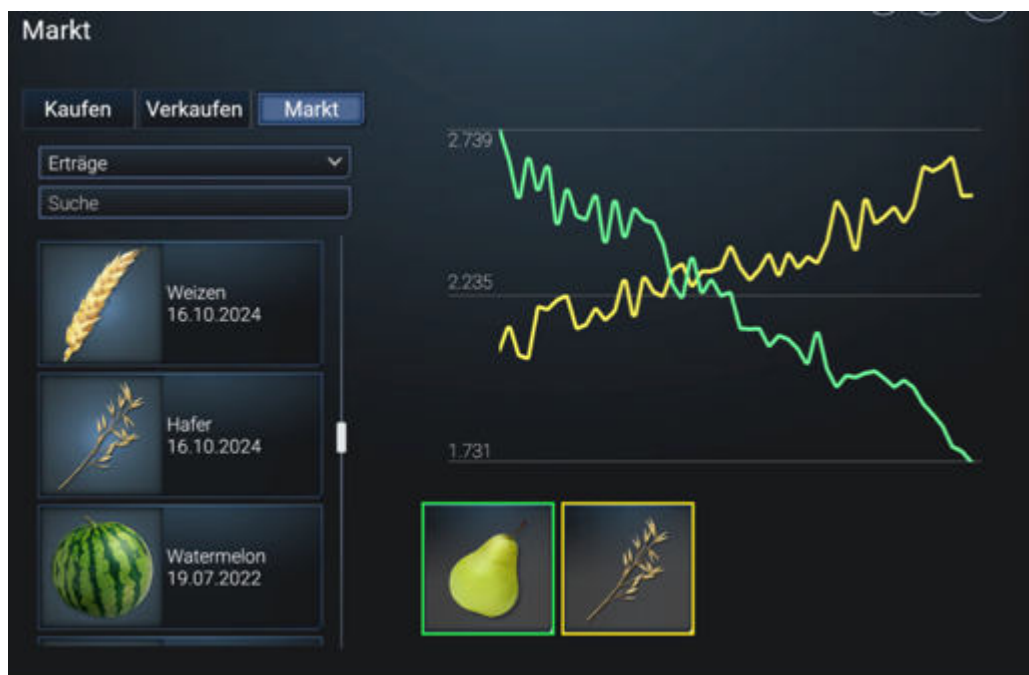
Abbildung 3: Gegenläufige Preisentwicklung von Getreide und Obst

Unter spielerischen Gesichtspunkten ist diese Vorgehensweise nur bedingt attraktiv, da sie schnell langweilig wird. Insofern bietet sie sich nicht als alleiniges Spielprinzip, sondern eher zur Ergänzung an.