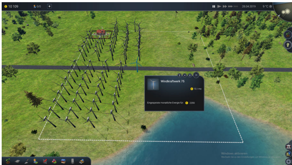
Abbildung 4: Windpark

Unter dem Gesichtspunkt der Wirtschaftlichkeit empfiehlt sich generell die Konzentration auf eine Tätigkeit, um die getätigten Investitionen möglichst gut zu nutzen. Allerdings kann dies vergleichsweise schnell zu Langeweile führen, so dass die meisten Spieler nach einiger Zeit vermutlich zusätzlichen Aktivitäten nachgehen dürften.