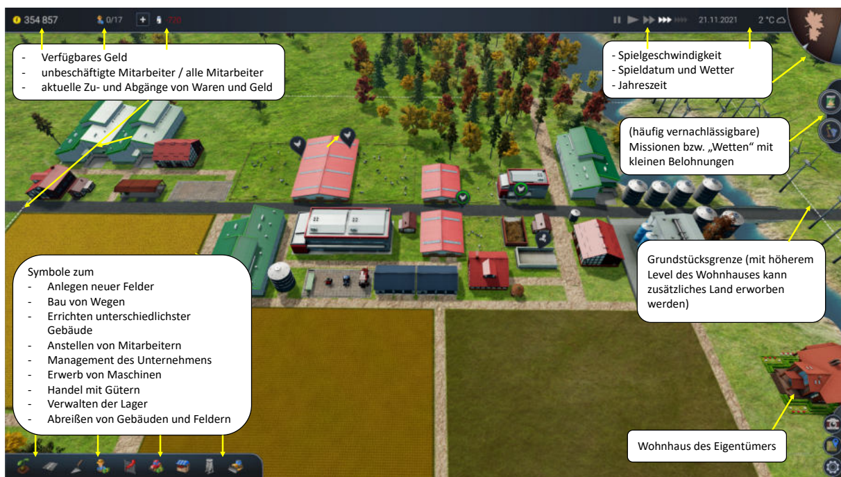
Abbildung 1: Bildelemente von Farm Manager 2018

Abhängig von der gewählten Spielstrategie sind nun weitere Gebäude zu errichten. Um ineffiziente Laufwege zu minimieren, sollten dabei funktional zusammengehörige Gebäude nahe beieinander positioniert werden, beispielsweise das Lager neben einem Verarbeitungsbetrieb oder Parkplätze für landwirtschaftliche Maschinen in der Nähe von Feldern. Jenseits der Hauptstraße können auch Wege eingerichtet werden, die die Bewegungsgeschwindigkeit der Arbeiter und Maschinen erhöhen.